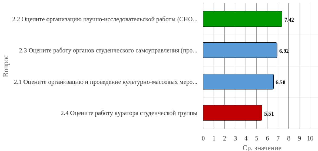
Диаграмма. 2. Распределение показателей уровня удовлетворённости студентов по блоку вопросов «Удовлетворённость организацией внеучебной деятельности».

Высокий уровень удовлетворённости не выявлен ни по одному оценочному суждению (Диаграмма 2).