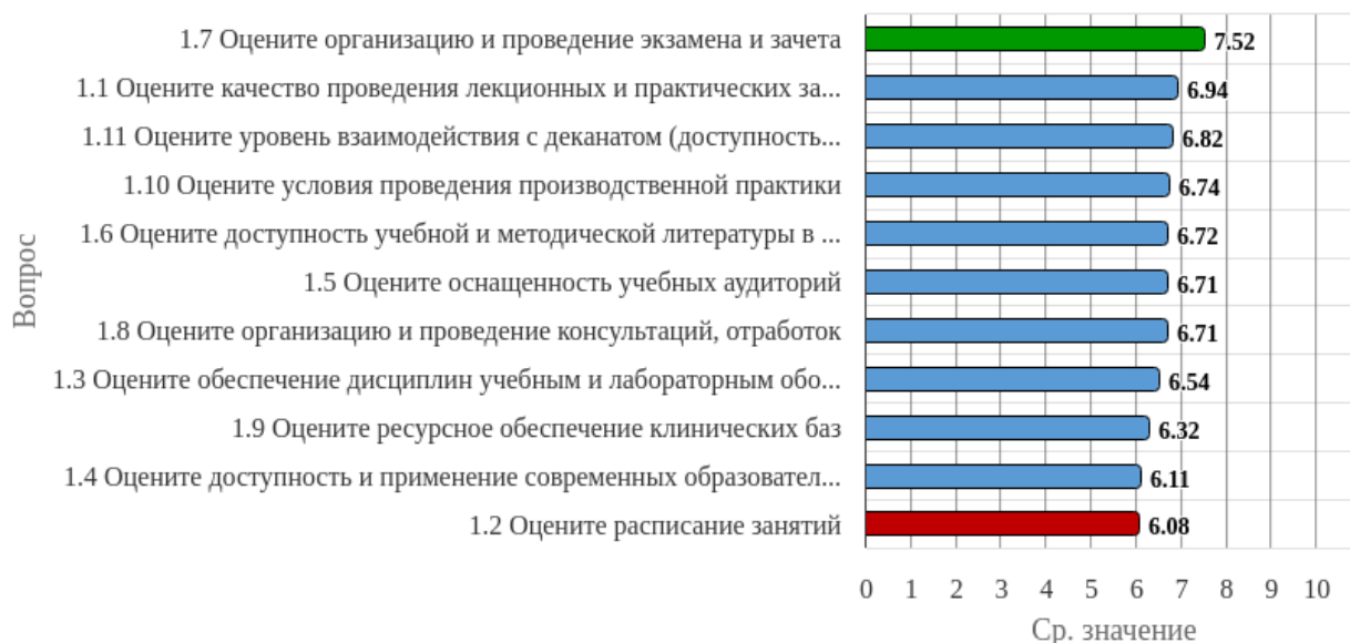
Диаграмма 1. Распределение показателей уровня удовлетворённости студентов по блоку вопросов «Удовлетворённость организацией учебного процесса»

Высокий уровень удовлетворённости отмечен по оценочному показателю «Организация и проведение экзамена и зачета» - 7,52 балла (Диаграмма 1).