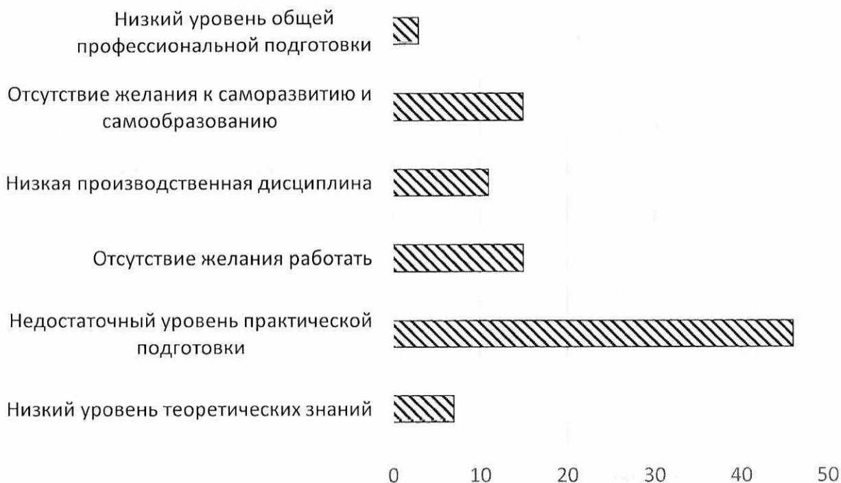
Рис. 2 – Основные недостатки выпускников ИГМА по мнению работодателей (на 100 опрошенных)

отсутствие готовности работать и отсутствие готовности к саморазвитию и самообразованию (по 15,2 на 100 опрошенных), на третьем месте – низкая производственная дисциплина и низкий уровень общей профессиональной подготовки (по 11,2 на 100 опрошенных) (рис. 2). Реже указывали на низкий уровень теоретических знаний среди выпускников – 7,7 на 100 опрошенных.